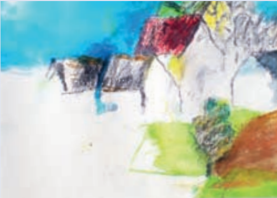
Landschaften und Portraits gehörten zu den bevorzugten Sujets von Rolf Bauer.