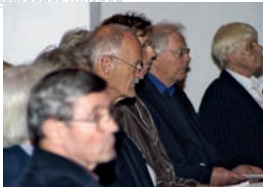
Die Theatergruppe Kandel aus Leonberg rezitierte in einer szenischen Lesung aus Originaldokumenten des „Euthanasie“-Programms.

Alle vier großen Einrichtungen der LWV.Eingliederungshilfe GmbH haben eine weit in die Vergangenheit reichende Geschichte, zu der auch die „Euthanasie“-Verbrechen der Nationalsozialisten gehören. Mindestens 32 Menschen mit Behinderung wurden aus dem Rabenhof Ellwangen in ein Vernichtungslager gebracht und dort ermordet. An jedem Jahrestag ihrer Abholung wird an sie erinnert.