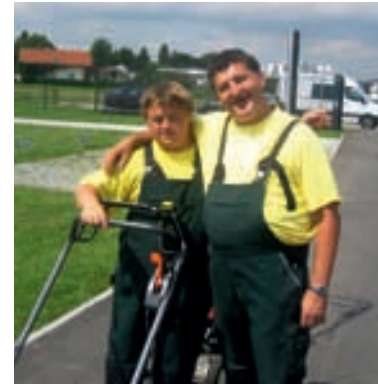
Im Einsatz bei der Firma Gummi Welz

Isolierung von Nutzfahrzeugen herstellt, wurde ausgeweitet. Im Juni betraute Gummi Welz die GaLa mit der Pflege und gärtnerischen Betreuung ihres rund 4000 Quadratmeter großen Firmengeländes. Mit einem VW-Bus und einem Tandem-Anhänger rückt die GaLa seither regelmäßig dort an. Inzwischen liegen bereits weitere Anfragen aus Ulm vor.